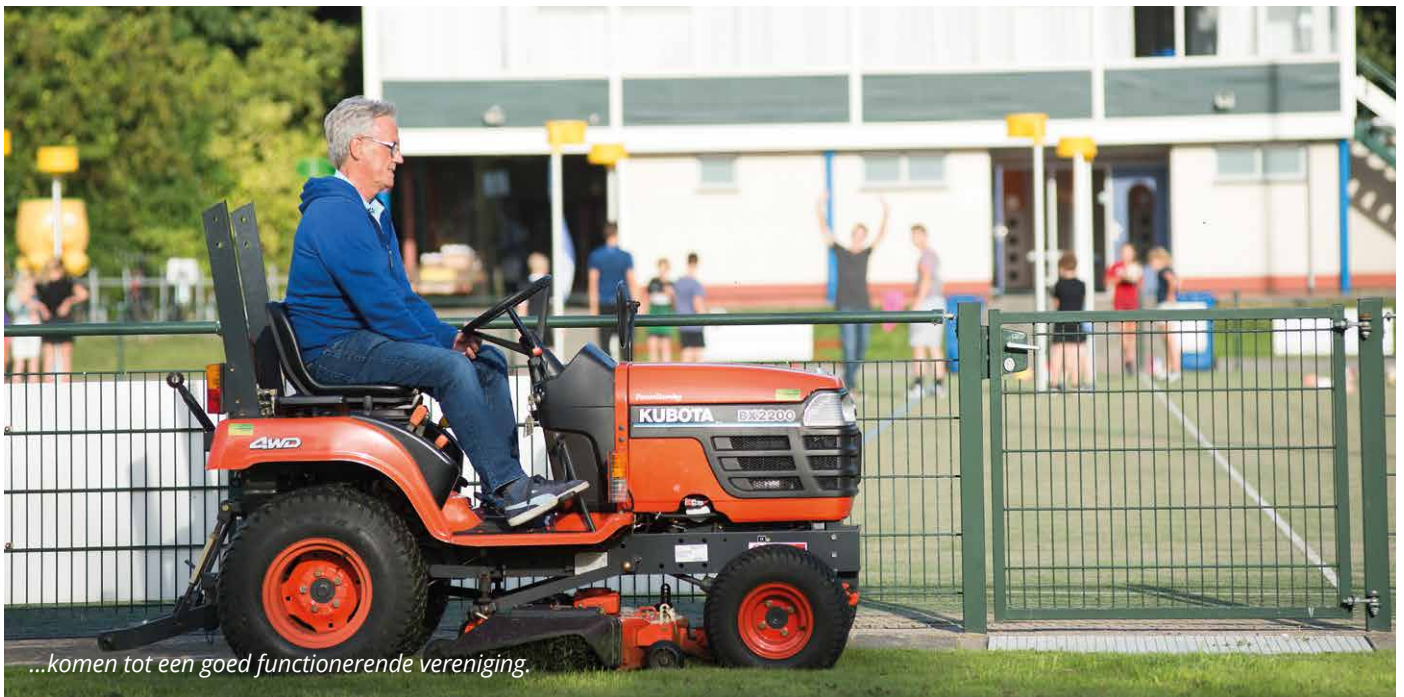
...komen tot een goed functionerende vereniging.

“We hebben in september al een bosdag gehouden met het nieuwe bestuur om samen na te denken over die vraag. Een van belangrijke taken is het organiseren van sociale activiteiten en netwerkborrels. Omdat ledenbinding een taak is die ook tijdelijk (gedeeltelijk)